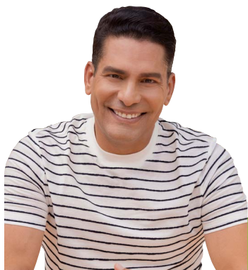
ISMAEL CALA - @CALA